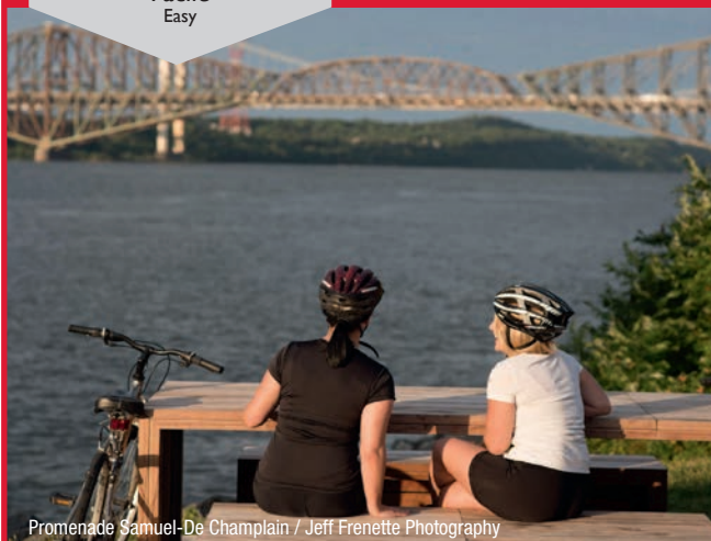
Promenade Samuel-De Champlain